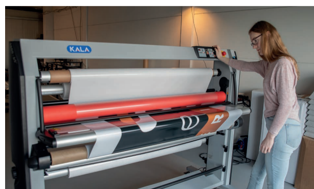
Roos bedient de nieuwste aanwinst: de KALA Mistral laminator.

We maken er A0-posters mee, maar we kunnen deze ook gebruiken voor autobeletering, stickers, one-way vision materiaal, etched glass, airtex en ga zo maar door. Daarnaast hebben we ook een Summa snijplotter en een KALA Mistral laminator, zodat we ook de verdere afwerking, vaak van specifieke materialen, nog beter onder de knie hebben en in huis kunnen afronden. Ook hebben we geïnvesteerd in een JWEI snijplotter op het grootformaat 800 x 600 mm. Daarmee hebben we een all-round snij-, ril-, slit- en stansoplossing in huis.'