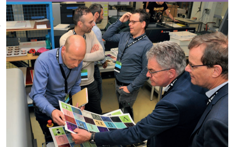
Volop belangstelling voor gepersonaliseerde drukwerkveredeling tijdens het Scodix Open Huis bij Wihabo.

Er was veel belangstelling voor het Scodix Open Huis dat bij Wihabo gehouden werd. Daar werden alle 'ins & outs' over digitale drukwerkveredeling met de Scodix Ultra2 Pro verteld. Wihabo is sinds medio vorig jaar in het bezit van deze veredelingsmachine, waarmee spot-UV en foliedruk variabel per vel aangebracht kunnen worden.