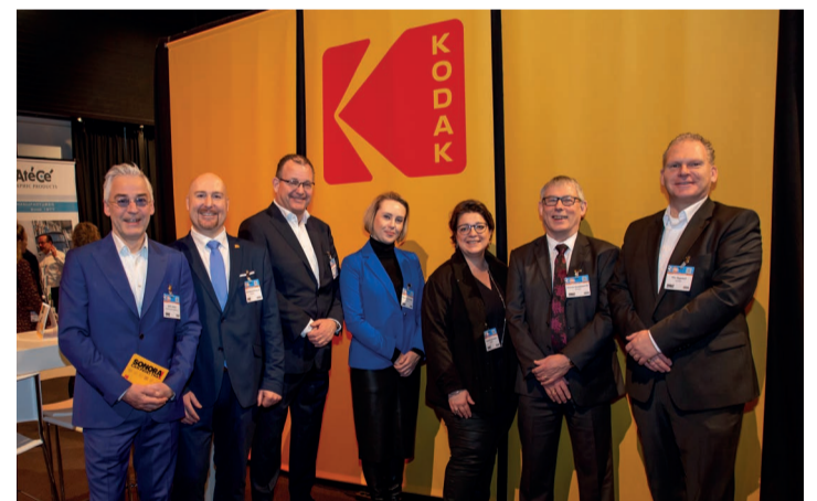
Het Kodak team tijdens de Vakdag Print & Sign.

Tijdens de Vakdag Print & Sign gaven Kodak en AtéCé invulling aan een sessie over groener en economischer drukken. Centraal stonden de voordelen die de nieuwste generatie procesloze offsetplaten Sonora X biedt. Na de sessie was er op de Kodak stand alle gelegenheid om 1 op 1 met drukkers, die zijn overgestapt, over de winstpunten te praten.