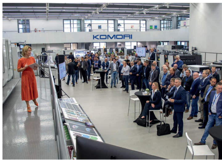
Het Komori Open House, getiteld 'Start Smart, Finish Better!', in het Komori Graphic Center – Europe (KGC) trok meer dan 400 bezoekers.