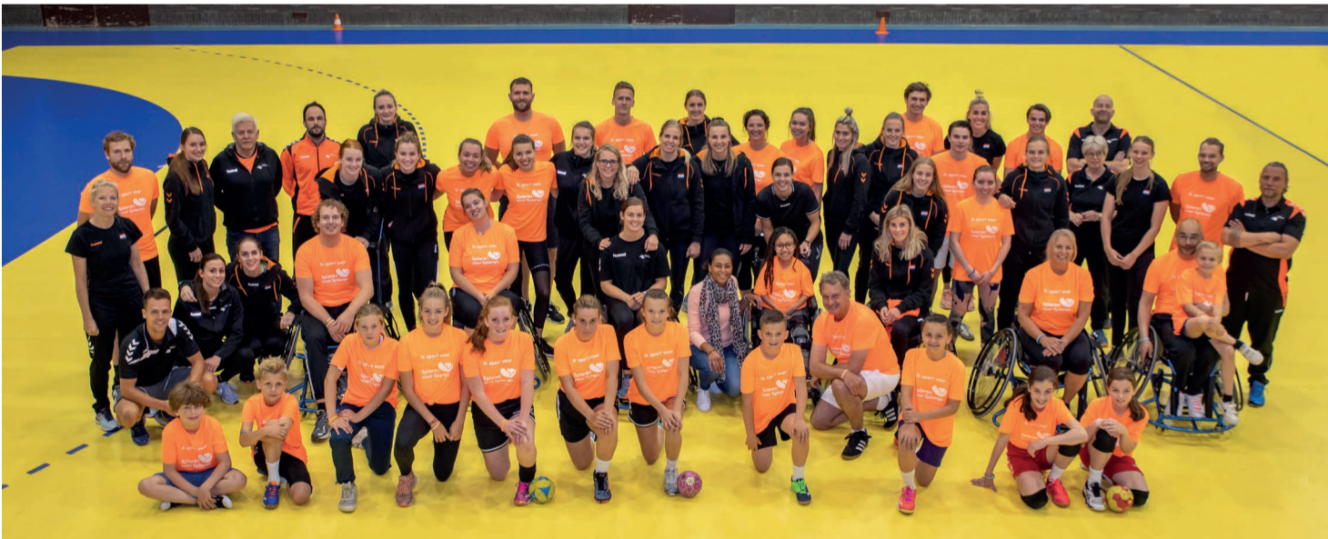
De deelnemers aan de PTI / Spielen voor Spielen Clinic Dames Handbal Team onder het motto: 'Gezonde spieren zetten zich in voor zieke spieren.'

bootcampen. De volwassenen en overige dames van Team NL kregen van de bondscoach les in rolstoelhandbal. Uiteraard stond er ter afsluiting ook een 'partijtje' rolstoelhandballen op het programma. Dat leverde alleen maar winnaars op en sloot goed aan bij de doelstelling waarbij gezonde spieren zich inzetten voor zieke spieren.