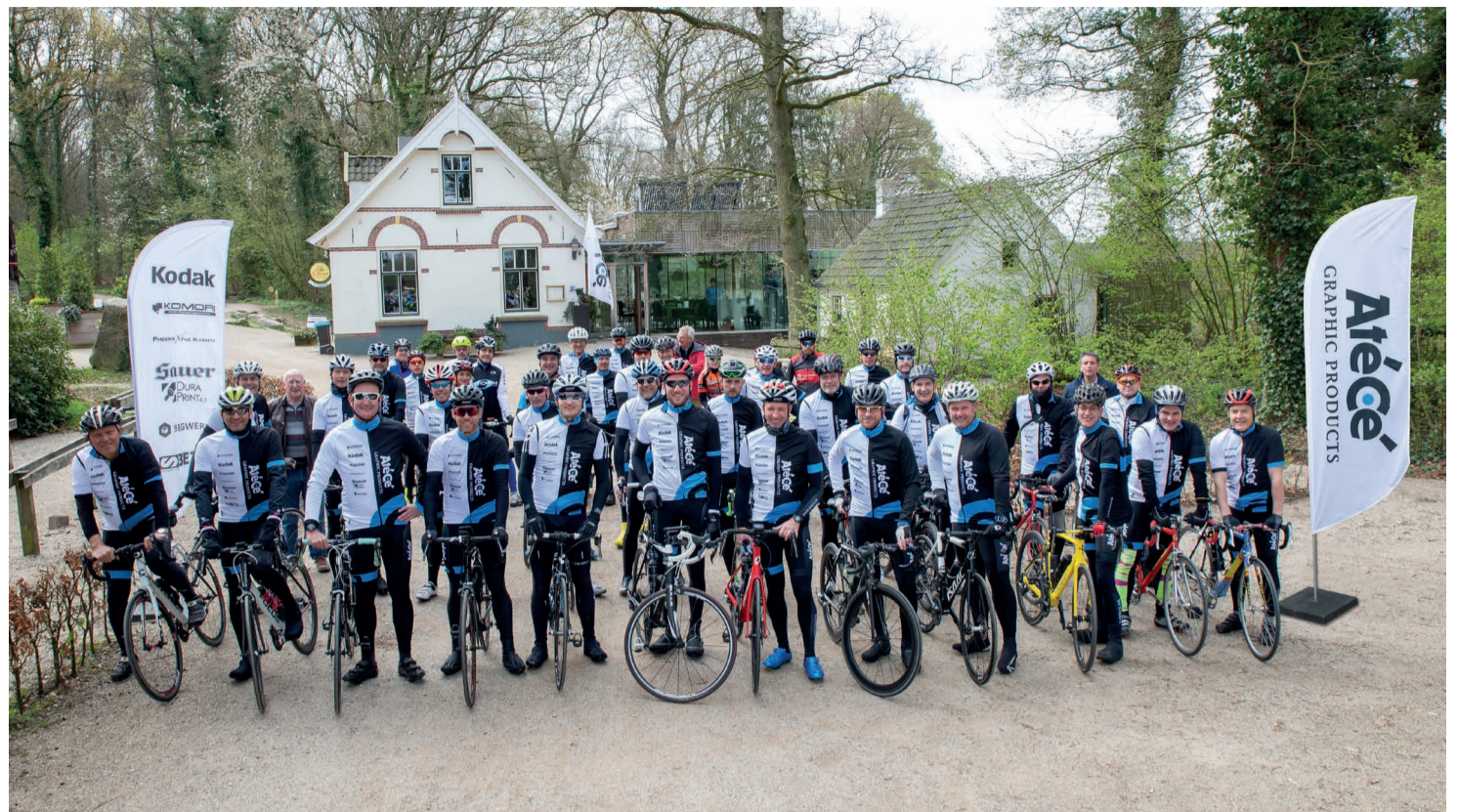
Het complete peloton voor vertrek bij Uitspanning 't Peeske in Beek.