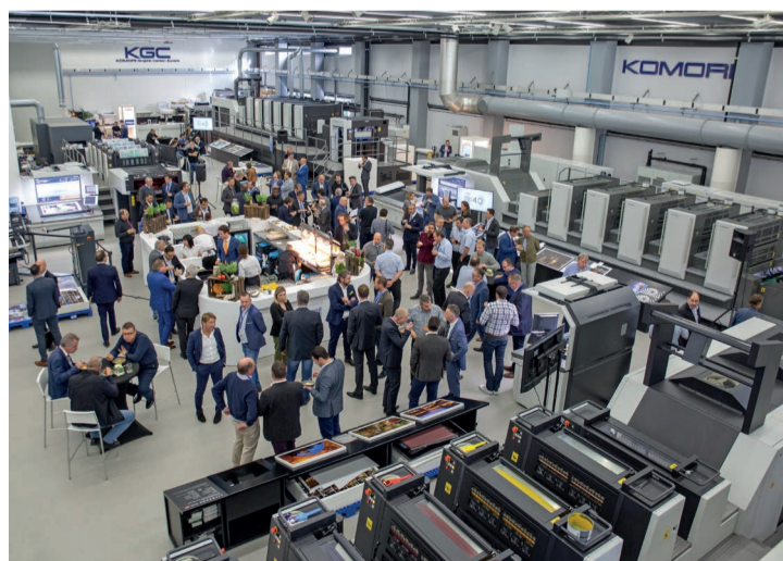
Het 'Komori Autumn Open House' wordt gehouden op 6 en 7 november 2019 in het Komori Graphic Center – Europe (KGC) in Utrecht.