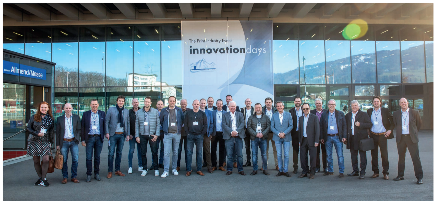
De gasten van Amstel Graphics bij het bezoek aan de Hunkeler Innovationdays.

De Hunkeler Innovationdays , die eind februari in het Zwitserse Luzern voor de 13e keer georganiseerd werden, waren opnieuw zeer succesvol. Meer dan 6.000 printprofessionals vanuit de hele wereld kwamen naar het tweejaarlijkse evenement, dat is uitgegroeid tot het grootste vakevenement voor hoogvolume printoplossingen in Europa. Ook de belangstelling vanuit Nederland was groot. De Innovationdays trok ruim 250 landgenoten, goed voor bijna 5% van het totale aantal bezoekers.