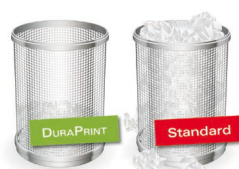
Minder inschiet papier