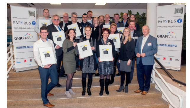
KW Ambassadeurs helpen de KW in stand te houden en meer dan dat.

De KW heeft eigen ambassadeurs. Die helpen de KW, één van de weinige overgebleven prijzen in de grafische industrie, in stand te houden en meer dan dat. 'Voor onze KW ambassadeurs is een belangrijke rol weggelegd om gezamenlijk het draagvlak voor kalenderproducten te vergroten', zegt Gerard Pfaff, voorzitter van stichting Kalenderwedstrijd. 'Eind vorig jaar hebben we de KW Ambassadeursclub opgericht en nu al hebben we meer dan 25 leden. Dat is voor mij een bevestiging dat agenda's en kalenders nog lang niet uit beeld zijn, integendeel. Wie onze KW ambassadeurs zijn? Die staan allemaal op onze website www.kalenderwedstrijd.nl . Daar staat ook hoe je, je kunt aanmelden voor dit initiatief. Wat mij betreft: doen!'