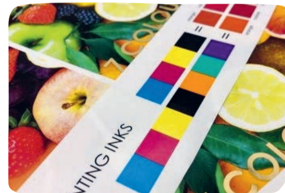
Seven Colour Printing

'Daarnaast biedt de combinatie van onze hoogwaardige 4-kleurenprocesinkten (CMYK) met onze Oranje, Groene en HR Violet (OGV) mengbasiskleuren een ideale oplossing voor drukkers die willen profiteren van de overstap naar 7-kleurenprocesinkten kleuropbouw. In de praktijk blijkt dat 25 tot 30% van de orders hiervoor geschikt zijn en er een enorme efficiëntieverbetering gerealiseerd kan worden.'