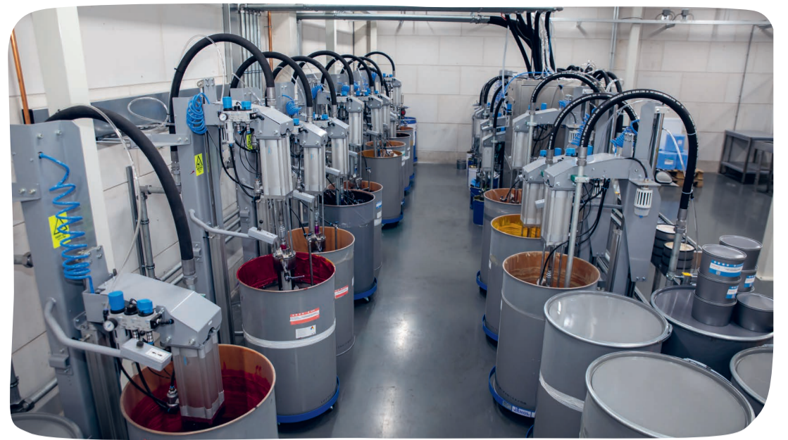
De grootste inkt mengkeuken in de Benelux.