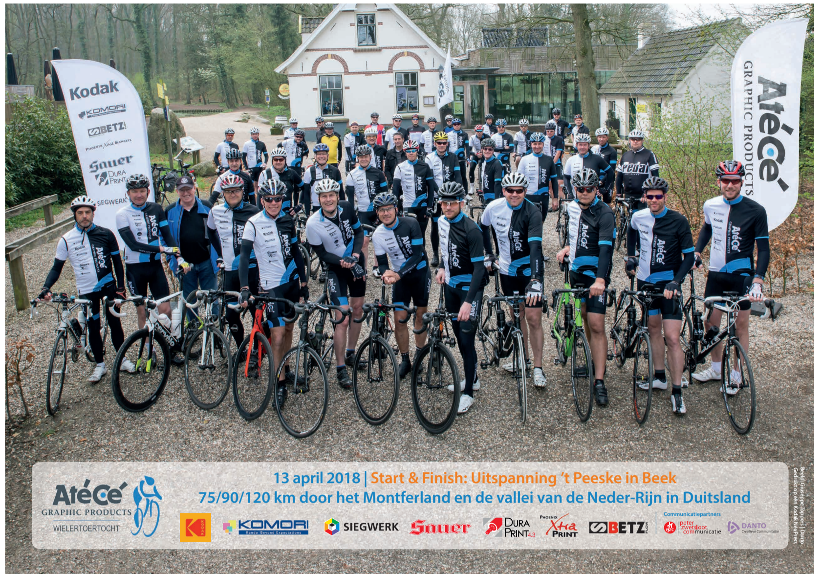
13 april 2018 | Start & Finish: Uitspanning 't Peeske in Beek 75/90/120 km door het Montferland en de vallei van de Neder-Rijn in Duitsland AtéCé GRAPHIC PRODUCTS WIELERTOERTOCHT KOMORI SIEGWERK Sauer DURA PRINT 4.3 Xtra PRINT BETZ Communicatiepartners: peter zwetsloot communicatie, DANTO Creatieve Communicatie

Vertrek en aankomst waren vanuit het Gelderse Beek. Er stond een recordaantal deelnemers – waaronder ook toerrijders uit Duitsland – aan de start voor een toertocht over 75, 90 of 120 kilometer. Onderweg waren er een aantal serieuze beklimmingen, in wielersjargon ‘kuitenbijters’ genoemd, opgenomen. Het weer en de sfeer waren van start tot finish goed. Alle deelnemers keerden dan ook moe, maar voldaan en veilig terug in Uitspanning 't Peeske in Beek. Daar werd onder het genot van welverdiende hapjes en drankjes nog lang over de grafische wielerklassieker nagepraat.