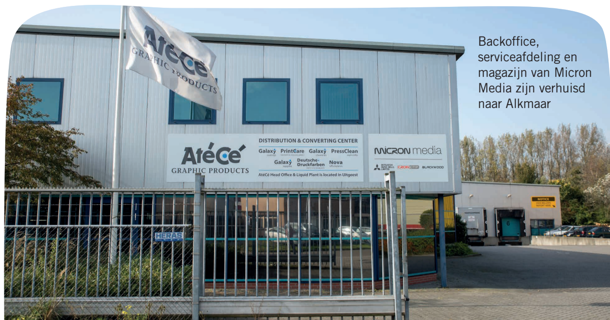
Backoffice, serviceafdeling en magazijn van Micron Media zijn verhuisd naar Alkmaar