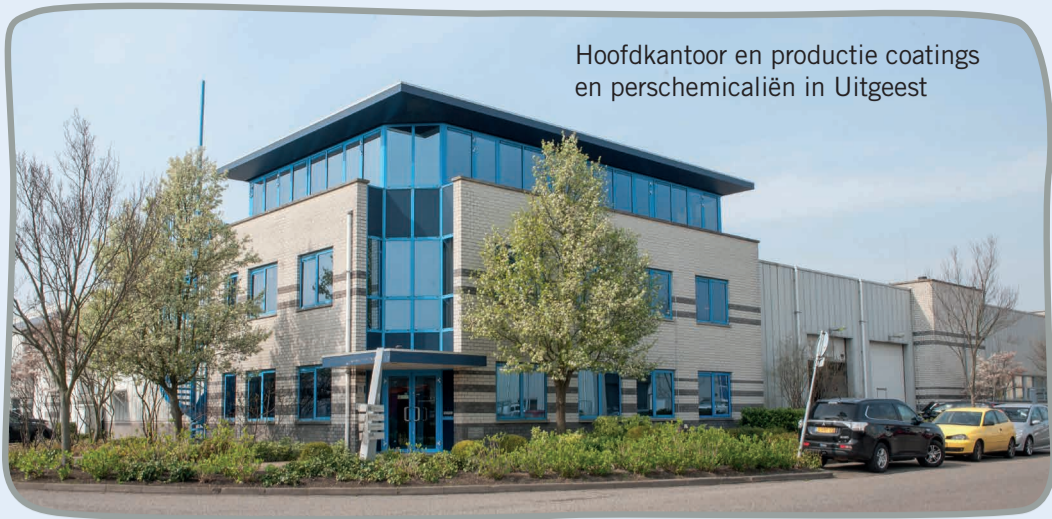
Hoofdkantoor en productie coatings en perschemicaliën in Uitgeest