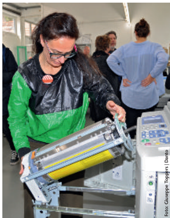
Voor iedere nieuwe kleur moet de drum worden vervangen.

In de grafische en document-industrie is de Riso Duplicator een categorie op zichzelf. Grafisch ontwerpers en kunstenaars werken graag met de machine, maar zijn er juist niet op uit om hun werk natuurgetrouw weer te geven.